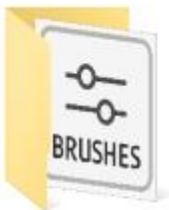
20 Rain PS Brushes.abr vol.6